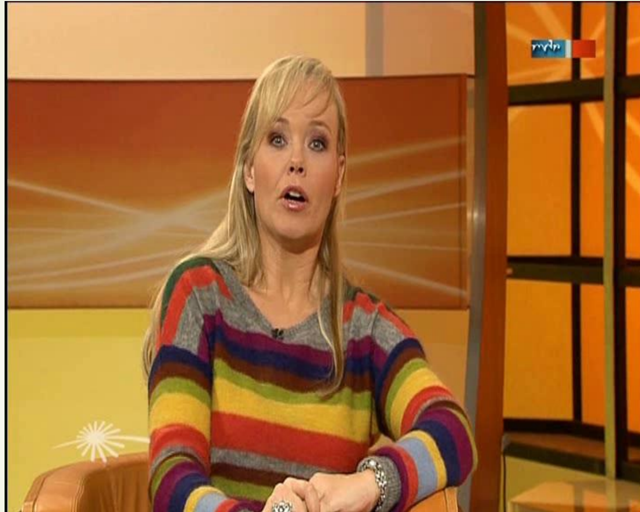
Hauptsache gesund 2013 , 4:00'