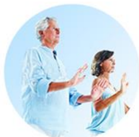
Tai Chi Mehr erfahren