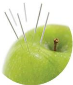
Akupunktur Mehr erfahren