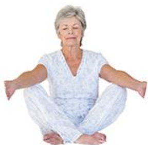
Geist + Körper Mehr erfahren