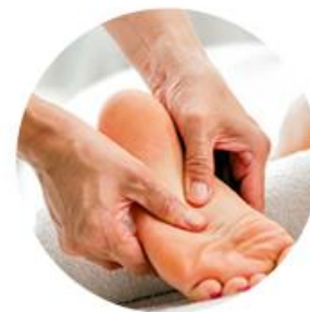
Massage Mehr erfahren