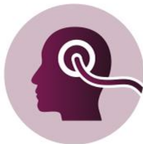
Biofeedback Mehr erfahren