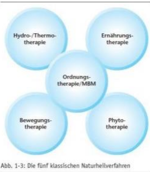
Abb. 1-3: Die fünf klassischen Naturheilverfahren